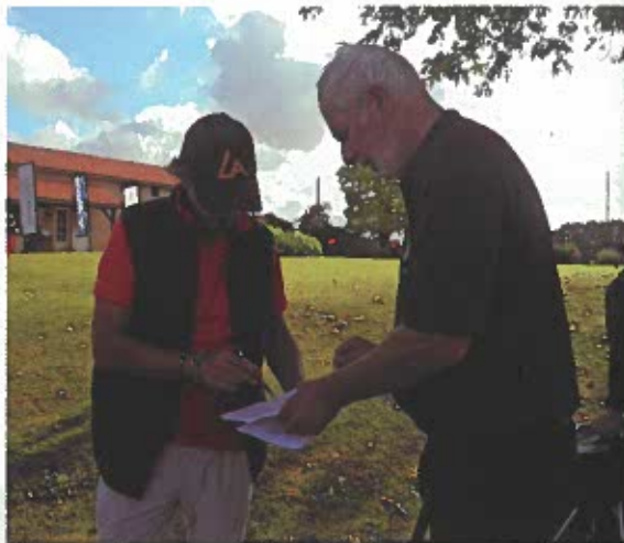
Comme au golf, on vérifie les cartes de scores en fin de parcours.