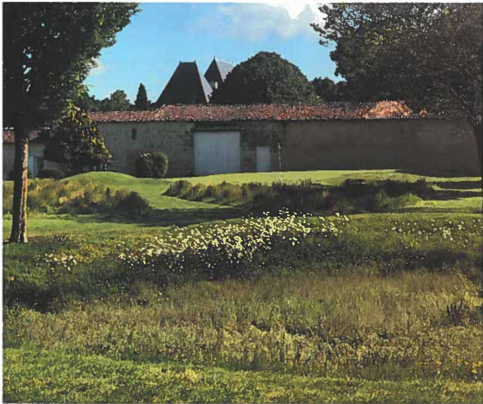
Le pitch and putt du Château de la Vallade, l'un des plus beaux de France.

Comme 60 % des coups au golf sont à moins de 100 mètres du green, le pitch and putt s'avère un formidable outil pédagogique.