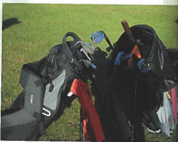
Au pitch and putt, on n'a le droit qu'à trois clubs, putter compris.

l'année d'ouverture du premier pitch and putt en France: le golf des Équipages à Brest, un 9 trous de 615 mètres, qui n'existe plus aujourd'hui.