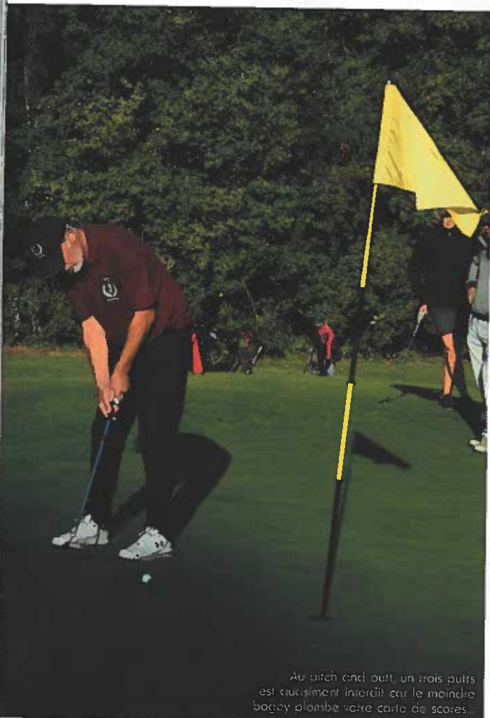
Au pitch and putt, un trois putts est quasiment interdît car le moindre bogey plombe votre carte de scores.